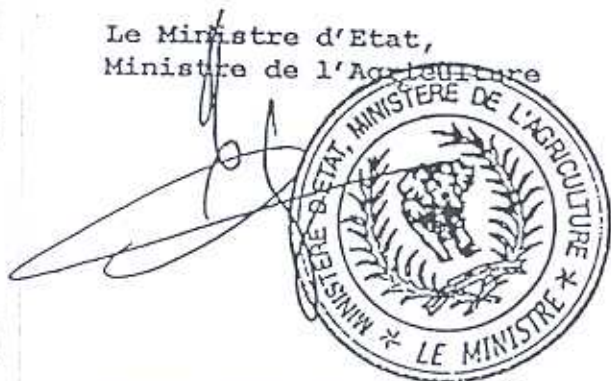
Amadou GON COULIBALY

Le Ministre d'Etat, Ministre de l'Agriculture